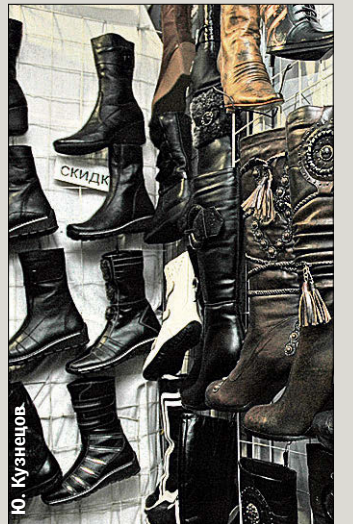
Сапоги. Без молнии — заготовка

Поэтому пишите претензию на имя директора. После подробного описания